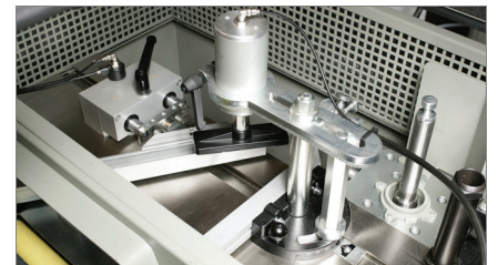
Grupo de mordazas y fuera escuadra 02